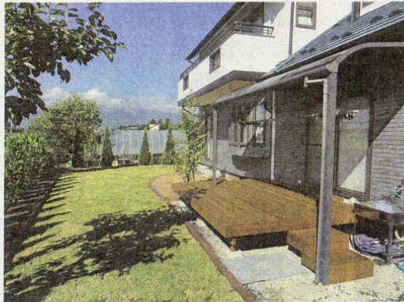
家族が庭にいる時間が増えるように施工した後の庭

庭の草木も誰かに頼んで植えてもらったものは、その後の管理に困りませんか。この木はどんな木か、この花は一年草か多年草かなどと考えながら自分で選んで植えた物は、その後も自分で管理ができるのではないのでしょうか。