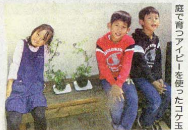
庭で育つアイビーを使ったコケ玉

造りを一緒に考え、その後も楽しみ方をアドバイスして、長くお客さまとお付き合いをしたいと思っています。