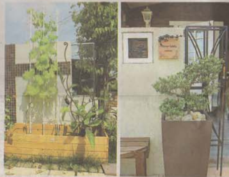
プランターでも家庭菜園は楽しめる