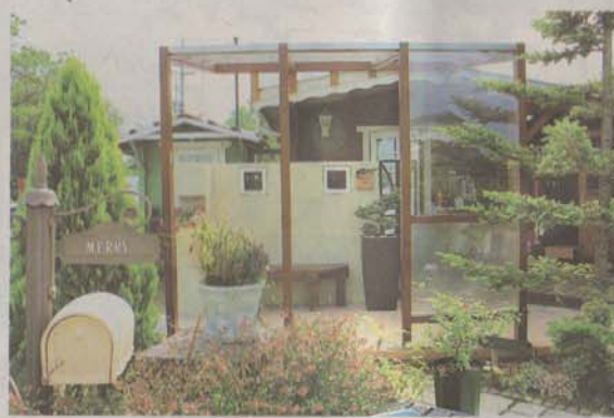
夏は、日よけスペースがあると庭での楽しみが広がる

庭は毎日、一生付き合つ場所です。きれいにしたり、人に見せたりするだけでなく、家族が一番楽しめる場所、安らげる場